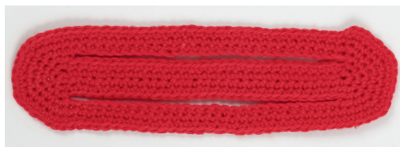
Een foto van de rode kant.